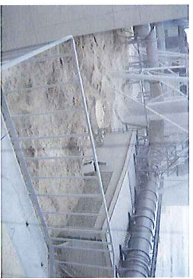
平成23年3月11日15時43分